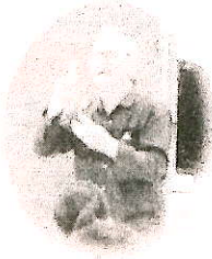
手話ボランティアグループ「たんぽぽ」